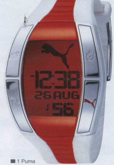
■ 1 Puma

■ 1 Puma Perfekter Sportbegleiter: Mit Drückern auf der Lünette kann die Trainingszeit ganz einfach eingestellt werden ■ 2 Casio Urbanizer: kantige Retro-Uhr, ein Nachfolgemodell der legendären, allerersten G-SHOCK „G-5000“ ■ 3 Esprit Digitalmodell aus der neuen High-End-Linie „Esprit collection“ ■ 4 Timex Mit der „Expedition WS4“ wird ein einzigartiges Messinstrument zur Unterstützung von Outdoor-Exkursionen vorgestellt ■ 5 Rosendahl Klare, schnörkellose Linien sind die Quintessenz für einen futuristischen Zeitmesser