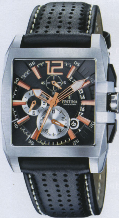
■ 5 Festina

■ 1 Jacques Lemans Das Modell „London“ bietet zusätzliche Lederarmbänder, die der Träger ganz leicht wechseln kann ■ 2 MeisterSinger „Granmatik“ im Edelstahlgehäuse ist eine Einzeigeruhr par excellence ■ 3 Timex In Tonneauforn präsentiert sich der groß dimensionierte „T-Series Tonneau“-Chronograph in Edelstahl ■ 4 Union Glashütte Ein schnellschaltendes Großdatum mit Steg verleiht dem Modell mit dieser mechanischen Komplikation seine unnachahmliche Ausstrahlung – ganz im Stil der Glashütter Tradition ■ 5 Festina Beim neuen Festina-Chronographen spielen matte und glänzende Oberflächen raffiniert zusammen ■ 6 Engelhardt Ein Sichtfenster gibt den Blick auf das Automatikwerk der im attraktiven Preissegment angesiedelten Uhr frei