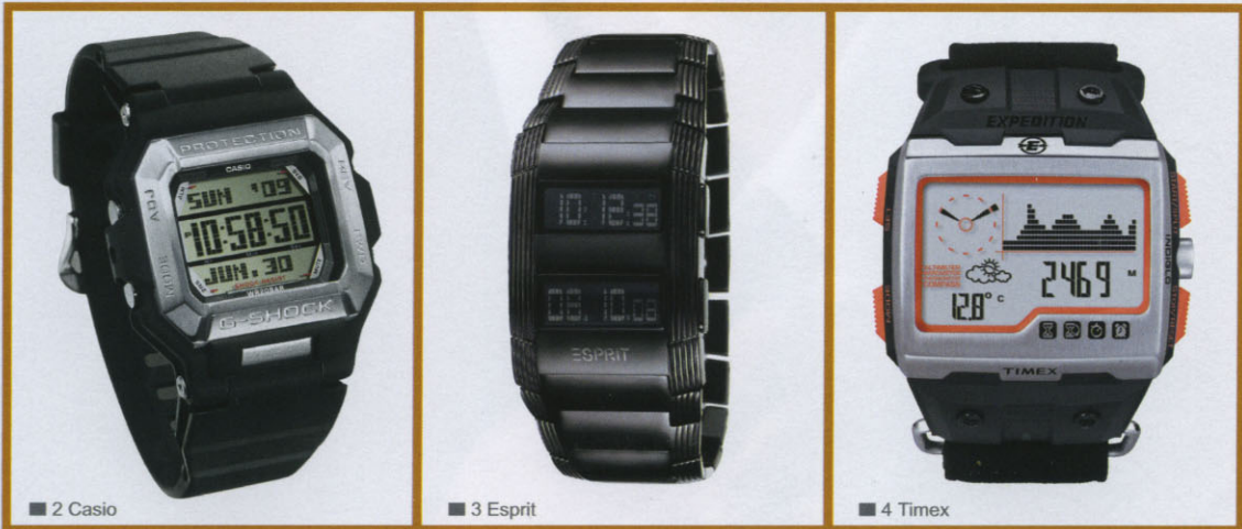
■ 2 Casio

■ 1 Puma Perfekter Sportbegleiter: Mit Drückern auf der Lünette kann die Trainingszeit ganz einfach eingestellt werden ■ 2 Casio Urbanizer: kantige Retro-Uhr, ein Nachfolgemodell der legendären, allerersten G-SHOCK „G-5000“ ■ 3 Esprit Digitalmodell aus der neuen High-End-Linie „Esprit collection“ ■ 4 Timex Mit der „Expedition WS4“ wird ein einzigartiges Messinstrument zur Unterstützung von Outdoor-Exkursionen vorgestellt ■ 5 Rosendahl Klare, schnörkellose Linien sind die Quintessenz für einen futuristischen Zeitmesser